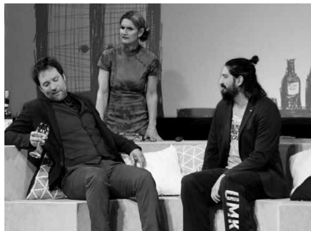
»Drei Mal Leben« · Spielzeit 2016/2017