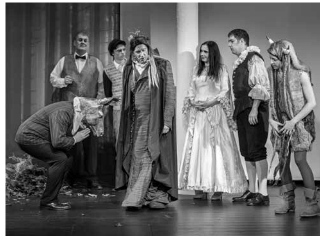
»Shakespeare in Hollywood« · Spielzeit 2016/2017