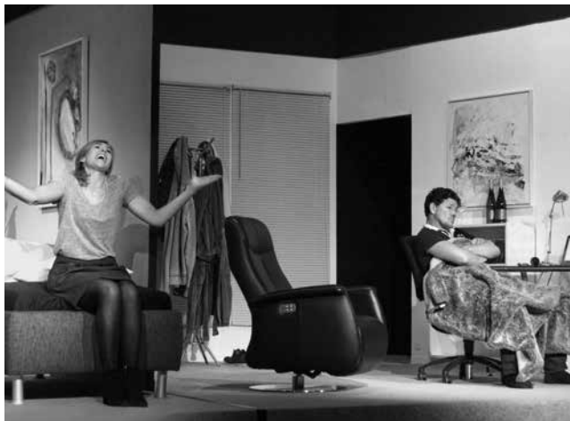
»Alle sieben Wellen« · Spielzeit 2016/2017