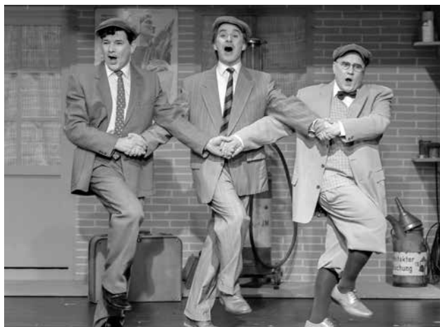
»Die Drei von der Tankstelle« · Spielzeit 2016/2017