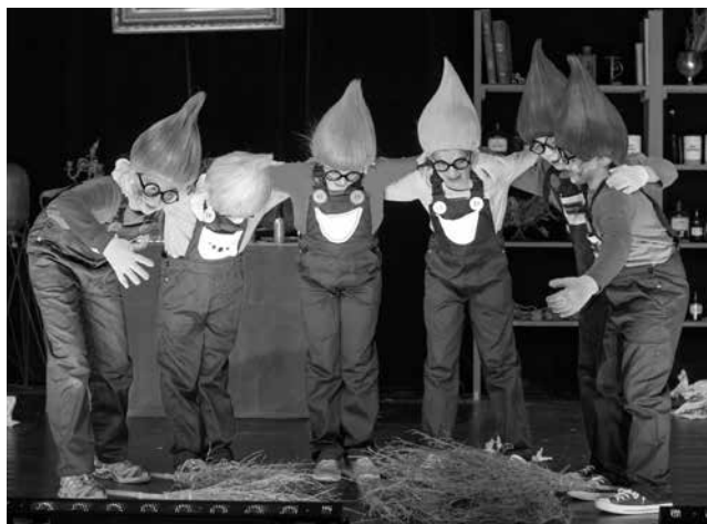
»Die Zauberlehrlinge« · Spielzeit 2016/2017