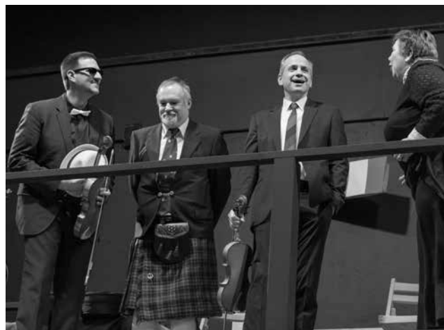
»Ladykiller« · Spielzeit 2016/2017